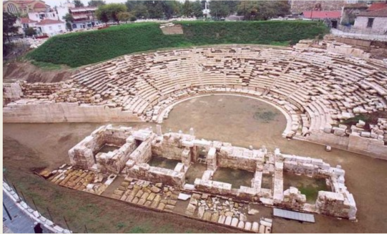
Teatr w Larysie